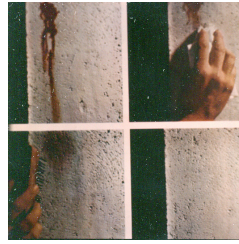
Tempo di lettura